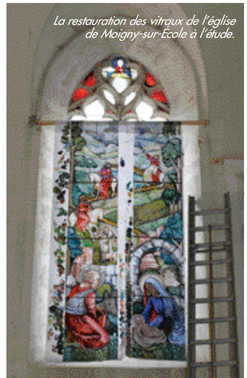
La restauration des vitraux de l'église de Moigny-sur-École à l'étude.

La Fondation Gaz de France a versé 25000 euros pour financer les nouveaux vitraux de l'église classée de Moigny-sur-École. À Saint-Sulpice-de-Favières, c'est la restauration des vitraux du Moyen Âge (100000 euros) que vise l'appel au mécénat lancé par la Fondation du Patrimoine (01 53 67 76 00).