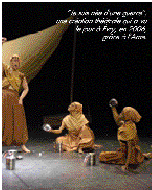
“Je suis née d'une guerre”, une création théâtrale qui a vu le jour à Évry, en 2006, grâce à l'Ame.