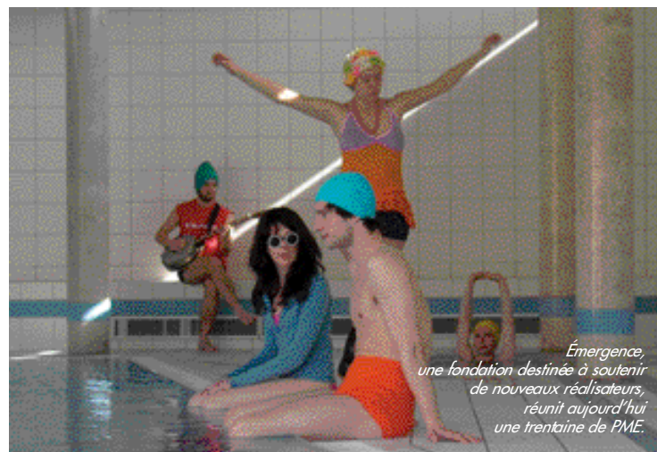
Émergence, une fondation destinée à soutenir de nouveaux réalisateurs, réunit aujourd'hui une trentaine de PME.