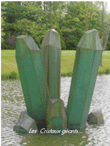
Les Cristaux géants...