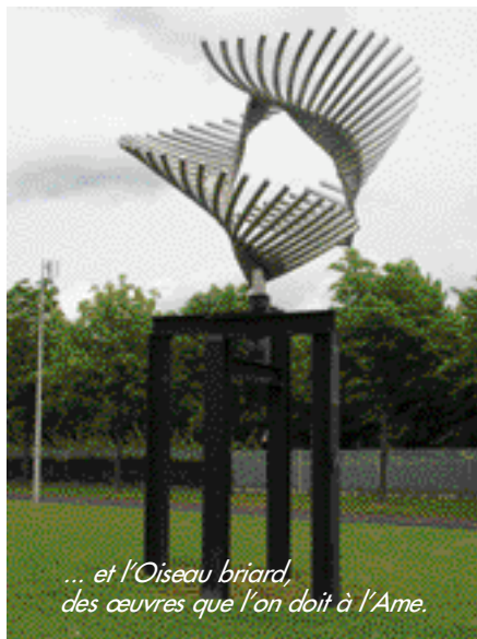
... et l'Oiseau briard, des œuvres que l'on doit à l'Ame.